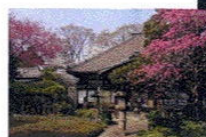
江戸時代からの古刹・無量寺の本堂をつぶして通る計画。地蔵盆も開かれる境内中央部は道路ができれば消滅する