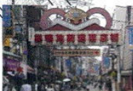
補助81号線(巣鴨・駒込・西ヶ原区間)

東京都が強権的手法まで発動させて強行しようとしている木密地域対策10年プロジェクトの特定整備路線。各地で住民の反対の声があげられ、東京都や国に対する事業のとりけしを求めるとりくみや行政不服申請などのたかひが各地でくりひろげられています。