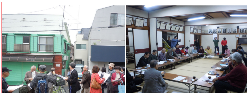
第1回 品川区補助29号線の調査と交流会風景

日時：9月3日(水) 15:00~19:30 予定 集合：15:00 JR京浜東北線上中里駅改札口(橋上駅・改札1カ所) 現地調査：15:00~17:00 補助81号線の調査 除外地：約300m、事業化部分：930m 交流会：17:30~ 巣鴨地蔵通り・巣鴨地域文化創造会館